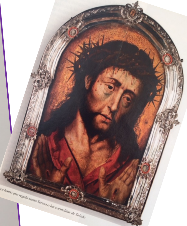
Ecce homo que regaló santa Teresa a las carmelitas de Toledo