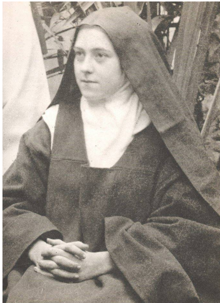
Teresa del Niño Jesús